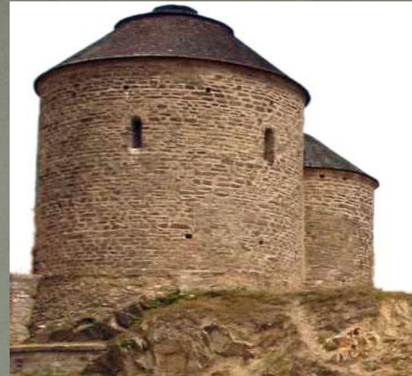
Rotunda sv. Kateřiny ve Znojmě