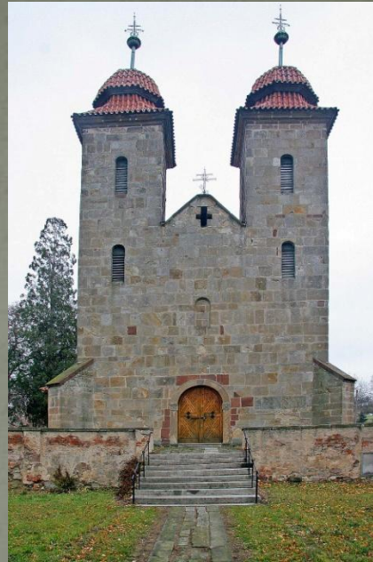
Tismice - průčelí románské baziliky